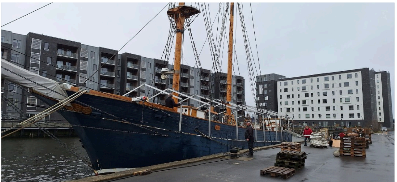
Nørresundby, 14. marts 2024: LOA kommer langt om længe af med vinteroverdækningen og mesanmasten ligger klar til at blive genmonteret

LOAs Venner arbejder på at få indsamlingsgodkendelse hos Indenrigsministeriet. I den forbindelse opfordrer støtteforeningen medlemmerne til at hjælpe med at finde nye medlemmer, så foreningen kan få den fornødne størrelse. Et af de formelle krav er, at foreningen skal have 300 medlemmer - tallet er i øjeblikket 183 personlige og fem firmamedlemmer. Se yderligere om medlemskab på www.loasvenner.dk under menupunktet "Støt LOA".